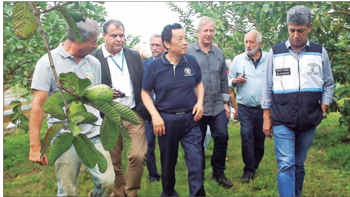
Diretor-geral da FAO conheceu de perto tecnologias de produção de alimentos

Para a FAO, a agricultura familiar é a modalidade que contribui diretamente para o combate a fome. E a primeira parada foi no sítio do Aduari, na Cachoeira Grande, que usou o suporte e assistência técnica da Secretaria Municipal de Agricultura Sustentável de Magé e do Escritório Local da Emater-Rio, para se tornar um produtor diversificado de frutas e de pimentões coloridos. Ele adaptou a área de cultivo de pimentões com sistema de irrigação e estufa, protegendo a produção de possíveis insetos e