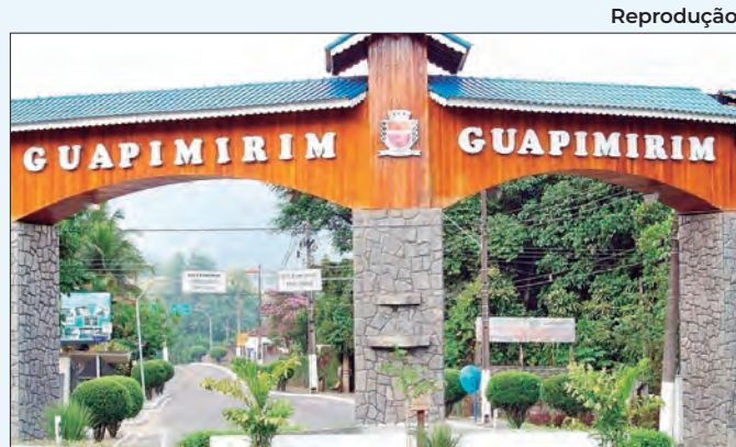
EJA em Guapimirim segue com inscrições até sexta-feira

com espectro autista em um ambiente totalmente adaptado. Todas as Sessões Azul contam com a promoção "Todo Mundo Paga Meia", ou seja, o cinéfilo paga o valor da meia-entrada, sem a necessidade de comprovação alguma.